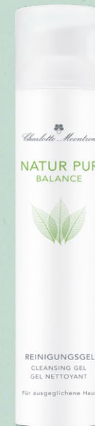
NATUR PUR BALANCE Reinigungsgel

Sie befreit die Haut von den täglichen Belastungen aus der Umwelt und bereitet sie auf die Pflege vor.