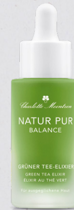
NEU NATUR PUR BALANCE Grüner Tee-Elixier

Grüner Tee-Extrakt wird aus den unfermentierten Blättern hergestellt. Er ist reich an Polyphenolen und schützt die Zellen vor oxi- dativem Stress.