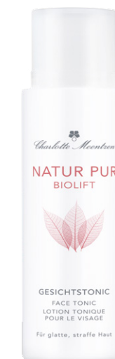
NATUR PUR BIOLIFT Gesichtstonic

Make-up, Talg und Schmutzpartikel bilden auf der Haut einen hartnäckigen Film, der gründlich entfernt werden sollte. Der sanfte Reinigungsbalsam befreit die Haut von allen Ablagerungen. Wein-Extrakte verbessern die Spannkraft, Traubenkern- und Avocadoöl halten die Feuchtigkeit fest und regen den Zellstoffwechsel an.