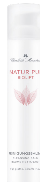
NATUR PUR BIOLIFT Reinigungsbalsam

Make-up, Talg und Schmutzpartikel bilden auf der Haut einen hartnäckigen Film, der gründlich entfernt werden sollte. Der sanfte Reinigungsbalsam befreit die Haut von allen Ablagerungen. Wein-Extrakte verbessern die Spannkraft, Traubenkern- und Avocadoöl halten die Feuchtigkeit fest und regen den Zellstoffwechsel an.