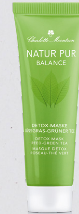
NEU NATUR PUR BALANCE Detox-Maske Süßgras-Grüner Tee

Eine ausgeglichene Haut strahlt vor Energie und wehrt Störfaktoren gelassen ab. Das konzentrierte Grüner Tee-Elixier erfrischt und beruhigt zugleich. Hyaluronsäure und Orangen-Fruchtwasser spenden lang anhaltend Feuchtigkeit. Extrakte aus Süßgras, Schisandra und grünem Tee haben einen ausgleichenden Effekt und bieten der Haut Schutz vor freien Radikalen.