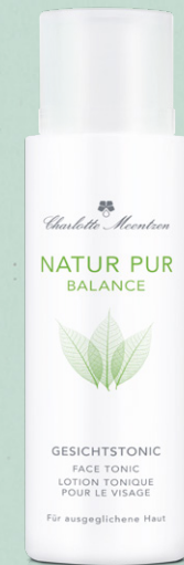
NATUR PUR BALANCE Gesichtstonic

Bei empfindlicher Haut gilt die Regel: Je sanfter, desto besser. Das milde Reinigungsgel entfernt Make-up, Staub und Umweltgifte sanft und trotzdem gründlich. Jojobaöl bewahrt die Haut vor dem Austrocknen und spendet Feuchtigkeit. Schisandra-Extrakt und grüner Tee beugen Irritationen vor und beleben.